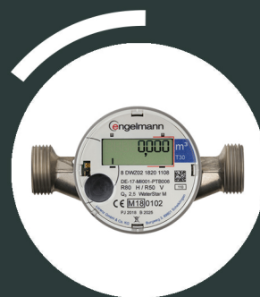
Compteur Eau Froide

Vous le trouverez dans la gaine palière située dans la circulation de votre étage de logement.